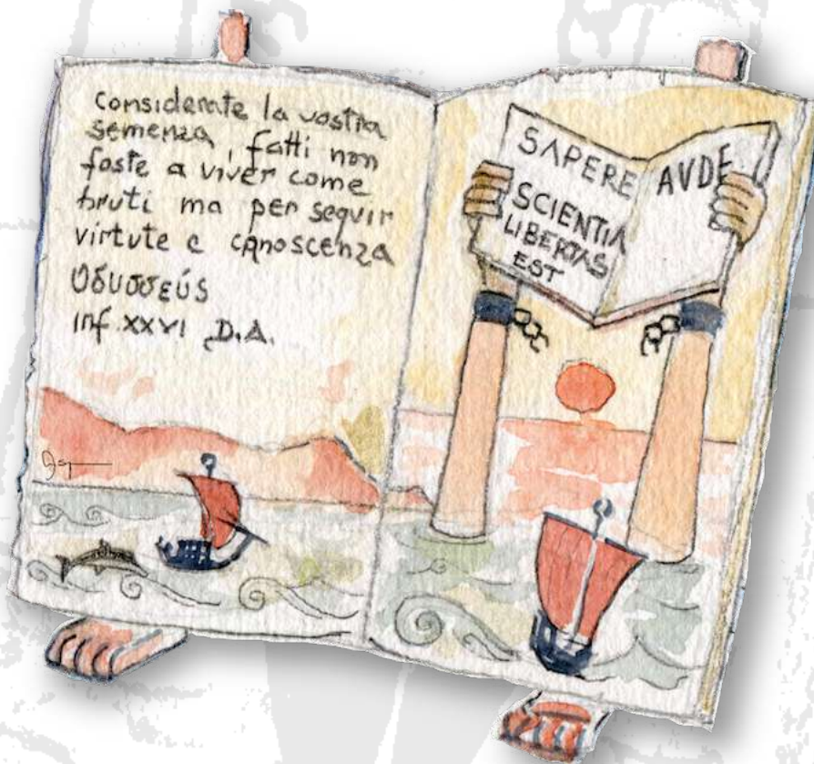
Le colonne d'Ercole (quale limite della conoscenza)